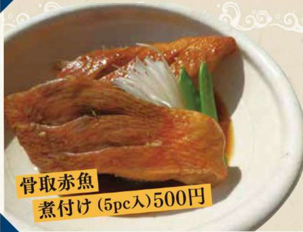
骨取赤魚 煮付け (5pc入) 500円