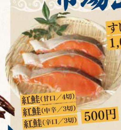
紅鮭(甘口/4切) 紅鮭(中辛/3切) 紅鮭(辛口/3切) 500円