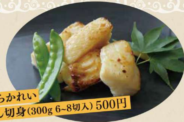
骨取あぶらかれい みりん切身 (300g 6~8切入) 500円