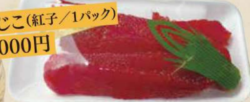
すじこ(紅子/1パック) 1,000円